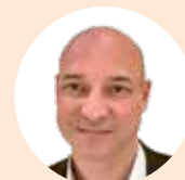
Thomas Bredereck VERLAGSVERTRETUNGEN HESSEN, RHEINLAND-PFALZ, SAARLAND, LUXEMBURG

T +49 (0) 42 141 70 819 E poelking-henkel@t-online.de